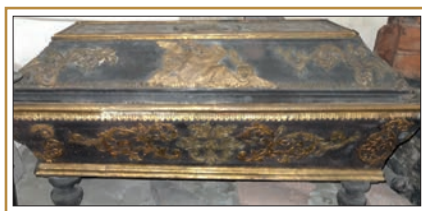
En av kistene som var i gravkammeret.

Børtings gravkammer ble revet i 1871 i forbindelse med utvidelsen av kirken til korskirke.