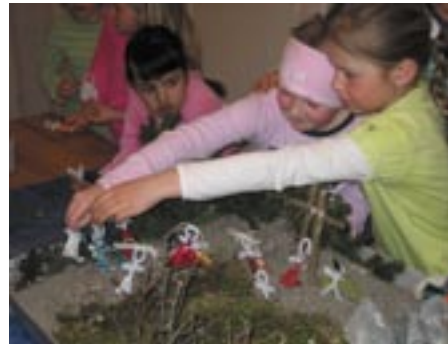
Fra byggingen av fjorårets "påskelandskap"

Også i år innbyr vi til påskeverksted på menighetshuset kl.11-13 lørdag 4.april, dagen før palmesøndag.