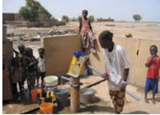
Borebrønn med pumpe

I Mali er det ikke noen akutt nødsituasjon, men Kirkens Nødhjelp driver langsiktig utviklingsarbeid. Vi skal hjelpe befolkningen nord i landet slik at de kan forbedre sin livssituasjon, kvinnene i området er en prioritert målgruppe. Det å styrke kvinnenes posisjon, og gi dem mulighet til å hevde sine rettigheter er avgjørende for å skape utvikling.