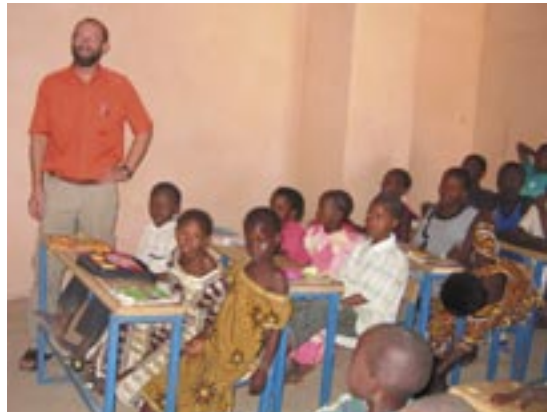
Barn på "hurtigskole" tar igjen tapte skoleår

Det legges stor vekt på å bygge opp lokale organisasjoner rundt de ulike hjelpetiltakene. I landsbyen blir det f.eks. etablert en egen organisasjon for drift av brønnen. Det å styrke kvinnenes stilling og innflytelse er avgjørende for å få til utvikling, og et viktig mål i seg sjøl. Gjennom opplæring og organisering opplever kvinnene at de sammen er i stand til å få til noe.