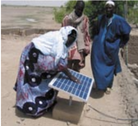
Solcelle hos en familie

Kirkens Nødhjelp har ei beredskapsgruppe med folk som kan påta seg oppdrag hvis det skulle oppstå et akutt behov for personell et eller annet sted i verden. Vanligvis brukes medlemmer i gruppa i forbindelse med katastrofer og nødhjelpsarbeid, men denne gangen er oppgaven min å fylle en ledig stilling ved regionkontoret i Mali i tre måneder.