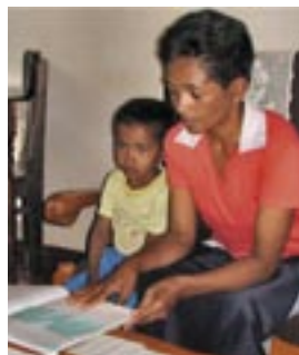
Her er en som har med seg sønnen sin mens mønsterboka studeres.