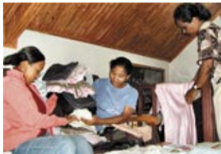
Noen av jentene viser frem arbeidet sitt

Det var nøye regnet ut at det var det de trengte.