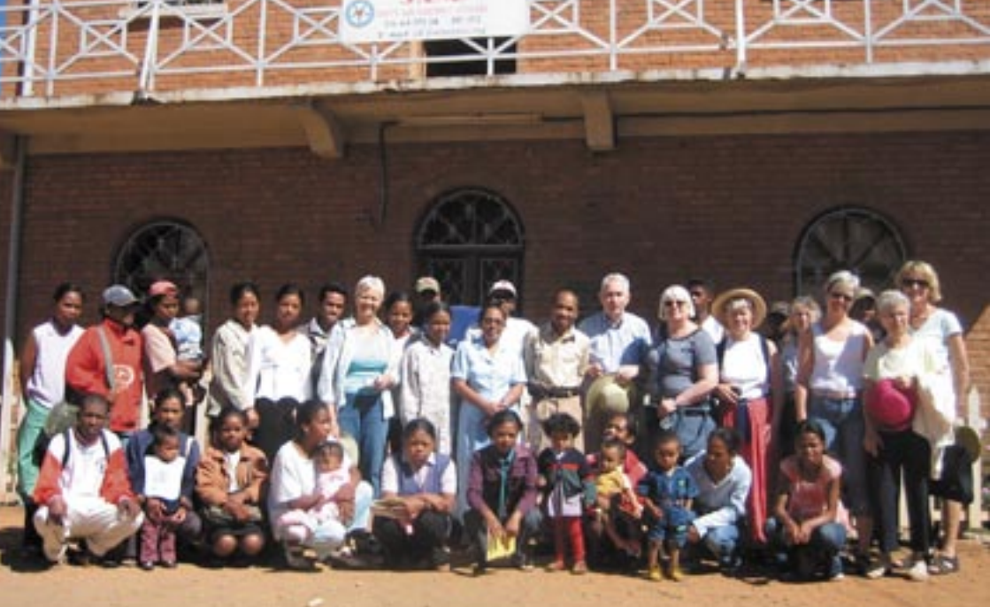
Gruppen fra Gjerpen sammen med noen av brukerne utenfor det diakonale ungdomssenteret i Antsirabé.

Madagaskar driver et omfattende sosialt arbeid. Vi ble svært imponert over det arbeidet kirkene driver.